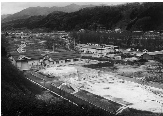
北部浄化センター（太田）

加入手続きにつきましては指 定工事店又は役場ダム対策課ま でお問い合わせください。