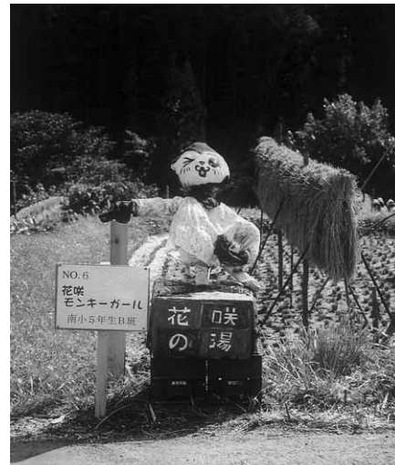
昨年の準グランプリ