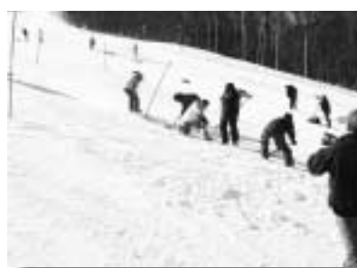
競技中も作業ご苦勞さまでした