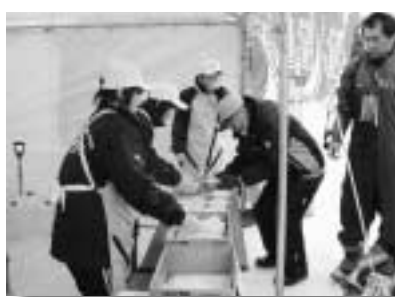
笑顔と温もりのふるまい