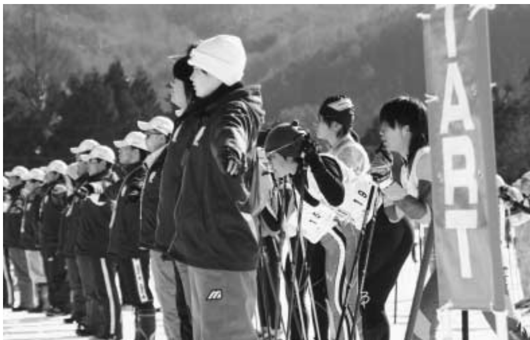
大会最終日になってようやく2月らしい天候になった（女子リレーのスタート前）

第五十四回全国高等学校スキー大会が二月五日〜九日までの五日間、片品村で開催されました。参加した選手の成績と協力頂いた役員や宿舎の方の感想を紹介します。