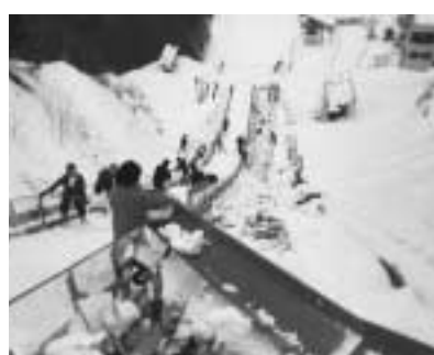
雪が少ない時も多い時も大変だった

※後記：年末は雪不足、年明けからは記録的な大雪で、各予選会等の開催が心配されましたが、大会役員皆様の連日による雪出、除雪作業のお陰で無事本大会を開催することが出来ました。期間中は皆様のご協力をいただき、スムーズな大会運営ができましたことをこの場を借りてお礼申し上げます。