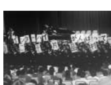
片品中学校生徒も合唱で歓迎した