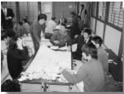
1区ワークショップ