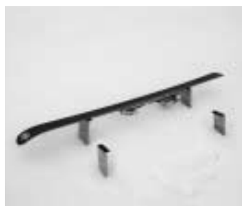
スキーセット後のスタートバイス