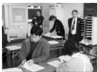
公式記録印刷作業（激励する村長）