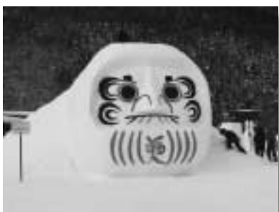
グループ企業で作成した五大幸福グルマ

スノーアートコンテストが二月四日から二月六日まで花の谷公園で開催されました。村内外のグループ企業・団体や学校生徒合計で二十二体のスノーアートを昼・夜を通して寒い中製作していただきました。会場には三日間で約5,000