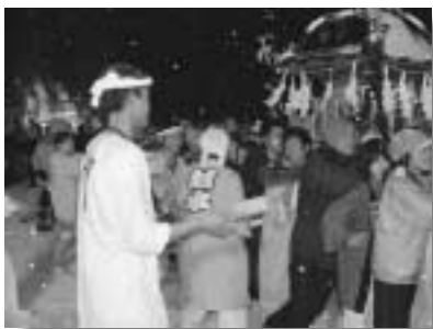
お客さんも仲間に入って、ワッショイ

〇人の方にご来場いただきました。本年も、村外からのお客様も多く、夜間のライトアップされた幻想的な会場で楽しんでいただきました。二月五日には、第十回越本御神火祭が中里広場で開催されました。会場には、約1,400人が集まり、越本神輿保存会の会員に混じり観光客の方も神輿を担ぎ回りました。また尾瀬太鼓の演奏や越本地区児童による「稚内ソーラン節」で祭りを更に盛り上げていただきました。関係者の皆様ご協力誠にありがとうございました。