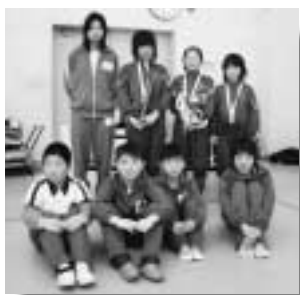
健闘した選手の皆さん

一月二十九日(日)利根郡子ども会上毛かるた大会がみなかみ町で開催されました。結果は次のとおりです。