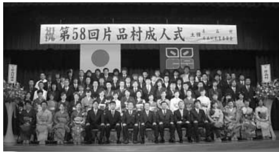
出席者全員で記念撮影

一月八日(日曜)、第五十八回片品村成人式が、成人者、来賓、家族の方々の出席により盛大に行われました。村長式辞、誓いのことは、来賓祝辞、記念品贈呈、答辞とスムーズに進行し、厳粛な雰囲気の中で、新人を祝うことができました。