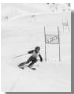
コースの上を通るスキー客から歓声があがる