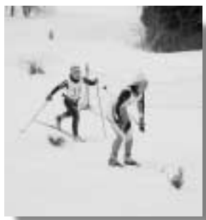
国体間近の良く整備された水芭蕉コース

クロスカントリースキー、アルペンが武尊牧場スキー場で行われ、両会場で村内各地より94名の選手が集い熱戦を繰り広げました。結果は次のとおりです。