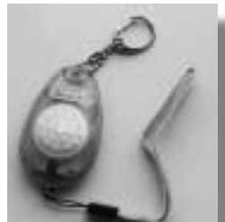
近くで聞くと耳を押さえたくなるような音を出す

児童・生徒の安全確保の一助のために、教育委員会では全児童生徒及び教職員に防犯ブザーを配布しました。ランドセル等に装着しているだけでも、犯罪の抑止になるとのことです。これを機に各家庭・各地域でも、子どもたちの安全について確認をして下さいますようお願いいたします。