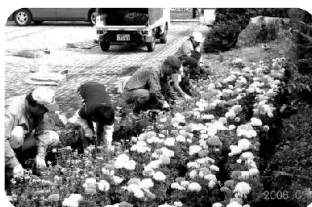
尾瀬大橋交差点付近での作業の様子

その活動の一環として、第1回ボランティア体験が7月2日（日）の8時から10時まで尾瀬大橋交差点付近で行われました。青少年健全育成推進員の協