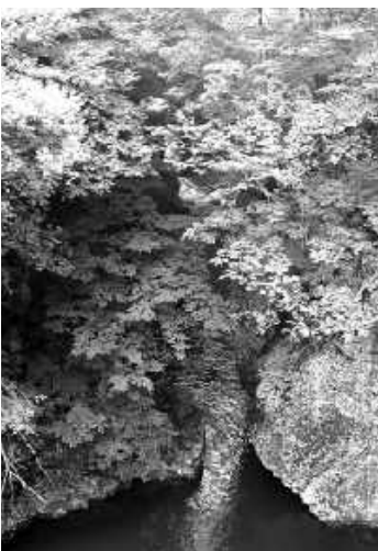
千坂橋歩道から望む片品渓谷

かなカーブとなり、快適な道路へと変わりました。用地提供者を始め、ご支援をいただいた関係者の皆様ありがとうございました。