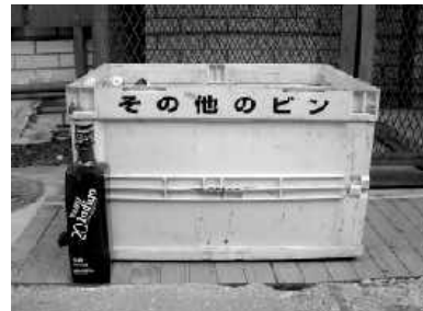
トライアングルはその他ビンに