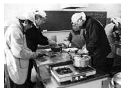
きっと役に立ちます

現在、片品村の高齢化率は26・1%で、約4人に1人が65歳以上です。その中でひとり暮らしのお年寄りも増えています。「ひとりになって自分でも自分で食べるものは自分で作って食べる。」これが丈夫で長生きするための秘訣でもあります。また、近く