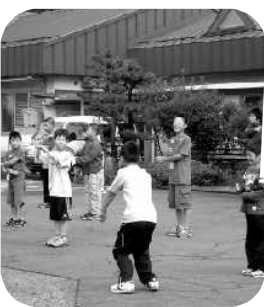
朝の集いでラジオ体操する子どもたち

悪天候のため小野子山登山ができず、予定が変更になりました。それでも、代わりの活動の竹とんぼづくりでは夢中になって製作し、実際に飛ばしてみてもうまく飛んだときにはとても嬉