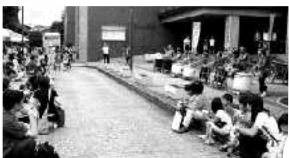
多勢のお客さんと尾瀬太鼓の皆さん

7月22日（土）埼玉県蕨市の蕨市民会館・中央公民館・蕨城址公園で蕨市サマーパークフェスティバル2006（第40回青少年まつり）が開催されました。