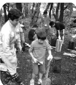
飯盒炊きさんはまず薪割りから

しそうでした。また、夜のぐんま天文台の見学も、霧のため残念ながら実際の星を望遠鏡で観察することはできませんでしたが、天文台施設や展示物また天文台職員によるプレゼンテーションを真剣に見たり聞いたりする姿が見られました。2日目の飯盒炊きさんも、班ご