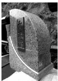
平成15年北小児童書親柱

7月29日(土)、土出ハイパスの開通式が挙行されました。戸倉ダム関連事業として、平成5年から工事に着手し、その間「尾瀬古仲橋」・「北谷戸橋」の開通(平成13年1月