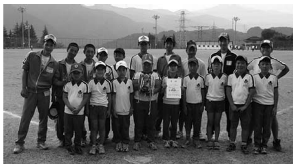
ソフトボールの部優勝1区子ども会

平成十九年七月二十九日（日）片品中学校校庭・体育館で第十一回片品村子ども会球技大会が開催されました。