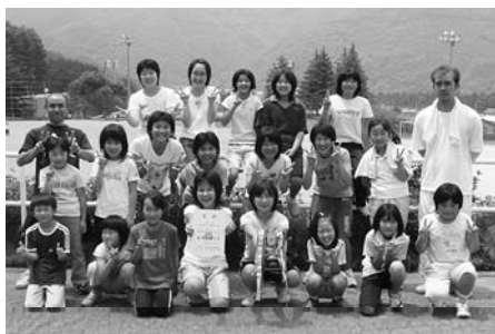
ドッジボールの部優勝6区子ども会

ファイト映画2006上映会日程 8/21(火) 13:00~ 片品村文化センター 8/22(水) 13:00~ 群馬会館