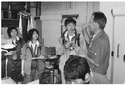
時計作りの工程を説明する 群馬精密代表

◎群馬ではプレス加工の技術が進んでいる。こんなすごい設備があるなんて全く知りませんでした。（群馬精密）