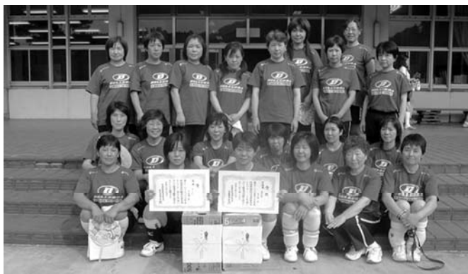
片品村5支部A・Bチームの集合写真

片品村からは、4支部2チーム・5支部2チームの合計4チームが参加し、5支部Bチームが優勝・5支部Aチームが準優勝とすばらしい成績をおさめました。また、4支部2チームもブロック2位と健闘し、敢闘賞トーナメントで共に第3位という成績でした。選手・役員の皆様は朝早くから大変お疲れ様でした。