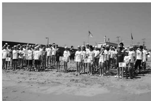
長崎海岸で海の学習

第一回から保存されている資料や写真を懐かしそつに見入っていました。滞在した三日間は、天候に恵まれ、長崎海岸での海の学習ではボランティア講師による磯の生き物調べや海水浴など太平洋を体で感じる事ができました。分宿では、漁の町ならではの温かさのなか児童達は交友を深めることができたようです。最後に同行の関係者と銚子市親師会・親和会の皆さん大変お世話になりました。