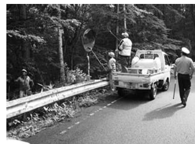
ミラーを覆う枝や草を刈払う

当日は、午前中に一斉街頭指導で、運転者に交通安全の呼びかけをし、午後には雨の降る中、片品村での交通事故が一件でも減ることを願いながらカーブミラーを磨き、邪魔な木の枝打ちや、草刈りなどを行いました。学校も夏休みにはいり、子供たちも外出する機会も増えると思います。