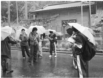
武尊神社前でメモを取る御座入班

◎武尊神社の彫刻は、日光東照宮の彫り師が彫った。 ◎水道を引いたのが村内で一番早かった。