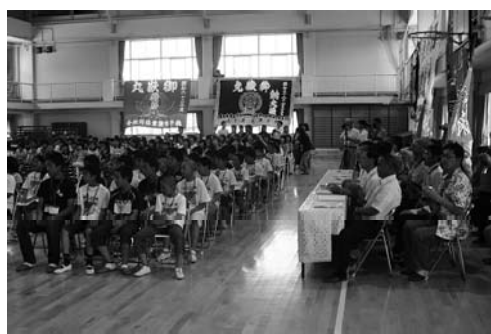
受け入れ式の様子

片品連合小学校一団は、児童四十九名を含む八十八名が三台のバスに分乗し明神小学校に到着すると、地元幼稚園児や関係者から手旗や上り旗で歓迎を受けました。