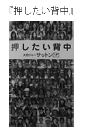
大田クルーサットン 著