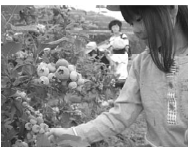
たくさんの陽を受けた果実

村内でのブルーベリー栽培の歴史は新しく、現在8世帯が栽培しています。多くは夏野菜生産経験者で、長年の農業の技術や経験と昼夜の寒暖の差を活かした果樹は深い甘みを出し、七月上旬から八月下旬までもぎ取りができます。子ども達や観光で見えたお客さんからも美味しいと喜ばれています。