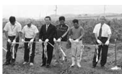
開園式のテープカット

七月十九日（木）、片品村ブルーベリー研究会による合同開園式が築地小林農園において行われました。