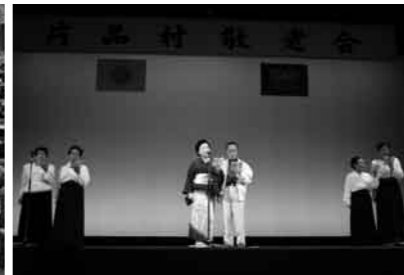
文化協会芸能部の皆さん