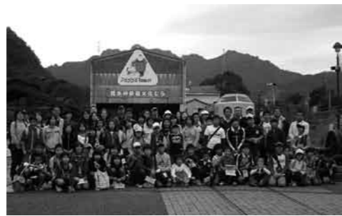
碓氷峠鉄道文化むら

片品村子ども会ハイキングを9月28日(日)に行いました。今回は世界遺産暫定リストに記載された「富岡製糸場」と「碓氷峠鉄道文化むら」を見学してきました。子ども会員、引率の役員、保護者総勢76名が2班に分かれ製糸場内を職員の方に説明していただき、繭から生糸になるまでの過程や養蚕群馬の歴史などを学習し工場内を見学しました。鉄道文化むらでは、今は廃線となった横川〜軽井沢間の鉄道の歴史や、全国を走った電車や機関車の展示車両を見学してきました。