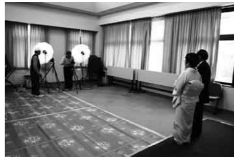
文化協会写真部による記念撮影

で各区ごとの集合写真と特設室で金婚式・高齢者夫婦・米寿の記念撮影が行われました。午前11時からの式典では、金婚式などの表彰と来賓の方々からの暖かい祝辞が送られました。第2部のアトラクションとして、片品村婦人会第1・第3・第4支部、片品村文化協会芸能部のみなさんによる歌や踊りが披露され、満席の会場を大いに盛り上げていただきました。敬老会員の皆さん、これからも健康に気を付けて、長生きをしてください。