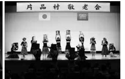
婦人会のアトラクション