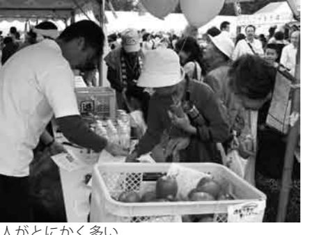
人がとにかく多い