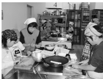
平成19年度 親子の料理教室の光景

今回は、焼きもちやけん汁など、郷土食をテーマに親子で楽しく料理を作り、会話を楽しみ、食事の大切さを学んで頂くために左記の通りの計画をしました。皆さんの参加をお待ちしています。 ○開催日時 平成20年11月29日(土) 午前9時30分～午後1時 ○場所 片品村役場2階調理室 ○対象 小学4年生～小学6年生とその親(子供のみの参加も受け付けます) ○定員 30名 ○参加料 200円 ○申込み×切 平成20年11月14日(金)