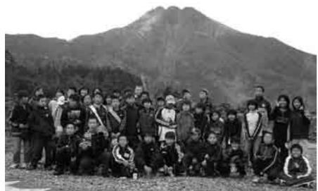
丸沼高原ロープウェイ山頂駅

してロープウェイに乗車し、標高2000mの山頂駅まで上がり、片品の自然を肌で感じる事ができました。蕨市スポーツ少年団員と交流を深め、思い出がたくさん出来たと思っています。交流会に参加の団員、関係者の皆様、大変お疲れ様でした。