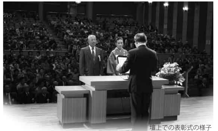
壇上での表彰式の様子

で各区ごとの集合写真と特設室で金婚式・高齢者夫婦・米寿の記念撮影が行われました。午前11時からの式典では、金婚式などの表彰と来賓の方々からの暖かい祝辞が送られました。第2部のアトラクションとして、片品村婦人会第1・第3・第4支部、片品村文化協会芸能部のみなさんによる歌や踊りが披露され、満席の会場を大いに盛り上げていただきました。敬老会員の皆さん、これからも健康に気を付けて、長生きをしてください。