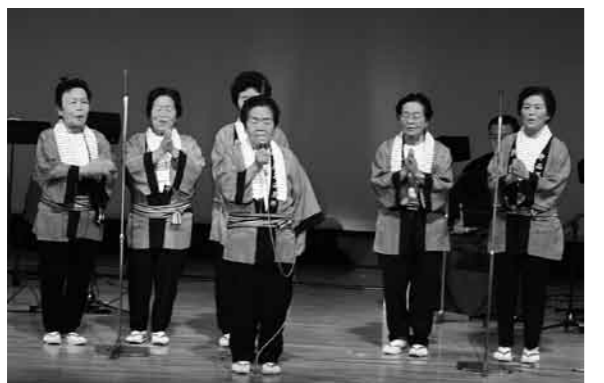
おけさ保存会のみなさん

民謡の第一人者が多く出演し、素晴らしい歌声と伴奏やお囃子で、あらためて民謡の魅力を発見できたお客さんも多くいたと思います。