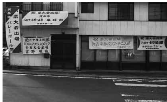
国道沿いの横断幕

鎌田、関越バスターミナル向かいの旧林書店の垂れ幕が例年になく多い事に気づきましたか？この垂れ幕は、中学校の部活動秋の新人大会で活躍した片品中各運動部の県大会出場をお祝いして作られたものです。利根郡新人大会は団体戦で優勝した1校だけ県大会に出場できます。顧問の先生方や保護者の熱意が生徒達を良い方向へ導いてくれたのかと思います。