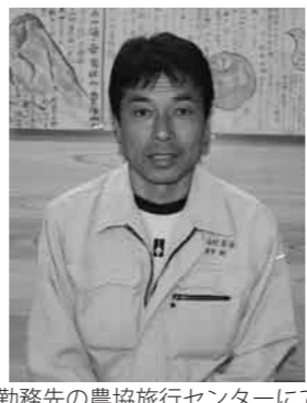
勤務先の農協旅行センターにて