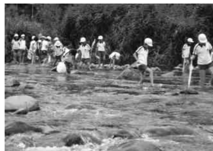
太田広場の河原で観察をしている児童たち

水温などを調べている子もいます。残念ながら、35名の子どもたちが近づくと、魚や鳥は逃げてしまうので、子どもたちが期待するほどの観察ができしていません。私自身、川や魚に触れることには、子ども時代から大変興味を持っています。これまで、明るい時間に地元にいることが少なかった中で、すっかりあきらめていた趣味を復活させ、夏休みからは何度か、朝晩を狙って魚を釣りに川に行っています。片品には、豊かできれいな水源が豊富で、まだまだ行ってみたい川がたくさんあります。