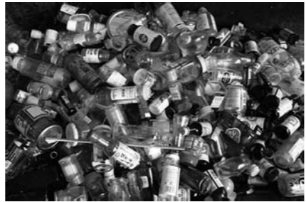
中身が残ったりして資源とはならないビン・缶類