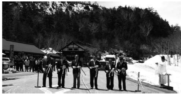
尾瀬太鼓の演奏に合わせてテープカット