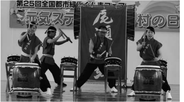
尾瀬の四季を演奏した尾瀬太鼓愛好会