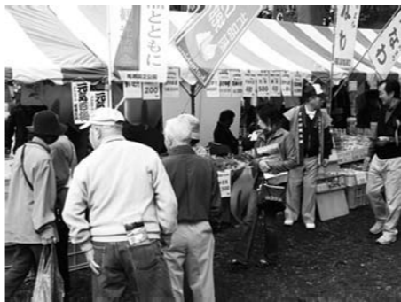
練馬区 照姫祭りの様子