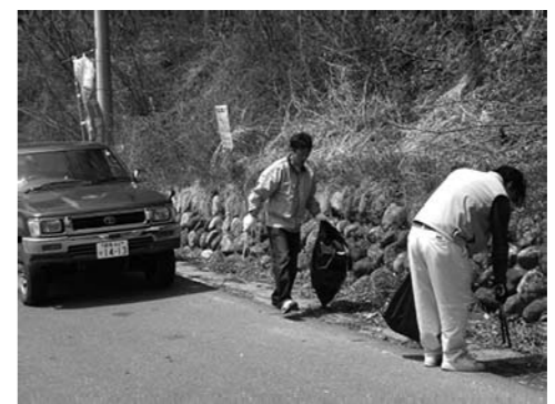
椎坂峠ゴミ拾いの様子

春の恒例行事となっている「国道120号・クリーン作戦」が4月23日(水)に行われ、今年は片品村スキー場連絡協議会・片品村民宿旅館組合連合会から合計26名の参加がありました。椎坂峠山頂に集合した参加者は120号を片品方面と沼田方面に分かれ、スキーシーズン中に捨てられた空き缶やゴミを拾い、約300kgものゴミが片付けられました。