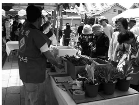
蕨市 苗木市の様子