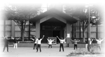
ラジオ体操のようす

5月1日(木)より、片品村文化センター前にて、片品カレッジ「みんなでラジオ体操」が始まりました。新緑が美しい季節になりました。さわやかな朝のひととき、ラジオ体操で心も体もリフレッシュしましょう。 場所は 文化センター前 時間は 火曜日は8時から 木曜日は7時30分からです 途中からでも、ちよつとだけでもけっこうです。ふるつてご参加下さい。 〔片品村教育委員会〕