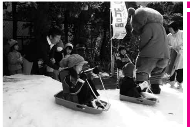
夏みかんの下に雪山を作った

3月10日(火)、都市の子ども達に雪遊びを体験してもらおうというイベントが、スキー場連絡協議会と民宿旅館組合連合会の共催事業として行われました。