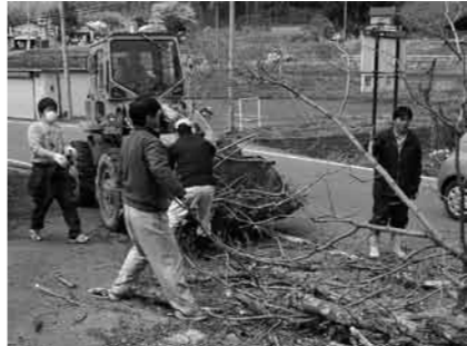
枝打ちを行う鍛冶屋地区の皆さん

地域の課題を住民自らの手で解決するため取り組む先駆的な地域づくり活動に対し助成する、地域の芽支援事業を募集致します。各種団体の皆さん、ぜひ、活用下さい。 ●補助対象事業者 区及び区内の団体。 ●補助対象経費 事業に必要な原材料・経費。 ●補助金額及び補助率 一つの区に10万円以内。 (予算の範囲) ●締め切り 5月22日(金) ●問い合わせ先 むらづくり観光課企画係 ☎(58)2112