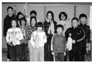
優勝したみなさん