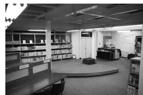
開放感が増した図書室

中央公民館図書室改修終了 耐震補強工事のため、中央公民館和室を臨時図書室として利用させていただいてきましたが、3月末から元の場所(中央公民館1階)で装い新たに開館しました。みなさんご利用ください。