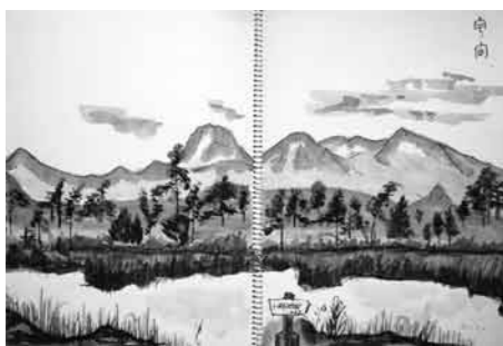
尾瀬で描いた水墨画

仕上げまで5日以上はかかるという植物画をスケッチブックで10冊以上、農作業の傍ら野の花を書いた小さなスケッチブック、旅先で描いた水墨画や水彩画など全てを見させていただくのは不可能でしたが、有意義な