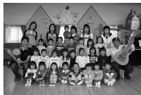
コンサート後に記念撮影

3月6日(金)、北保育所父母の会主催で、年長児の卒園を祝いコンサートを開催しました。