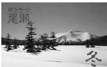
提供した写真が切手シートに

*花を描き始めたきっかけを「片品の花を全部描きたかったから」と利一さん。今後も健康に留意され充実した毎日が送れることを祈念いたします。