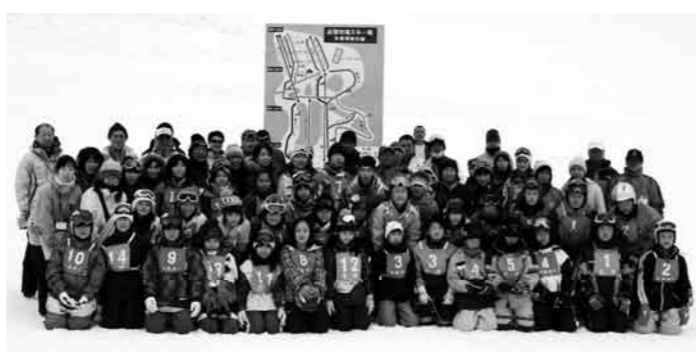
楽しかったスキー