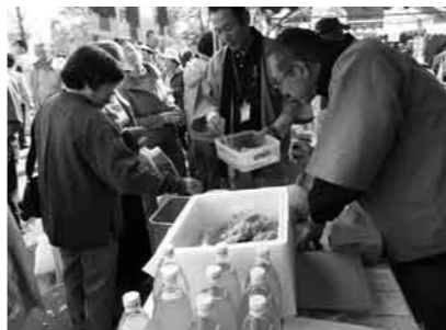
蕨市イベントでの販売風景