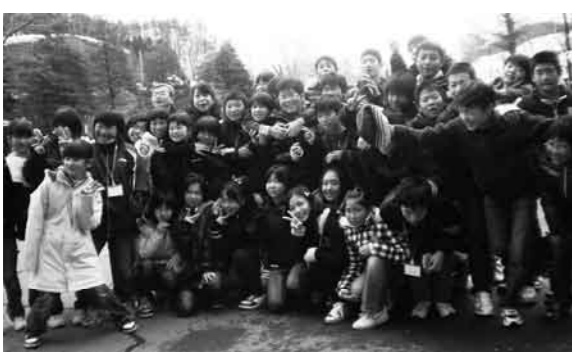
帰りのバスに乗る前に