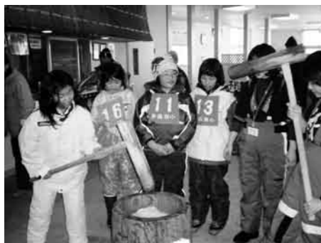
掛け声とともに餅つき

二日目は、村内の四スキー場(かたしな高原スキー場、スノーパーク尾瀬戸倉、武尊牧場スキー