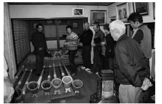
月原さんの説明を熱心に聞くクラブ員