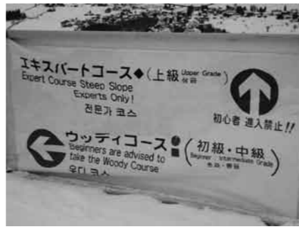
外国からのお客が多く看板もこの通り