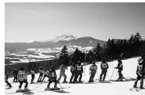
浅間山を見ながらコースの下見

3月13日(土)・14日(日)の2日間第39回群馬県スポーツ少年団スキー交流大会が嬭恋村のバルコール嬭恋スキーリゾートと草津町の草津音楽の森クロスカントリーコースの2会場で開催されました。 片品村からは59名の選手が参加し、結果は次のとおりでした。