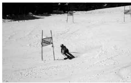
緩斜面が長いコースだった