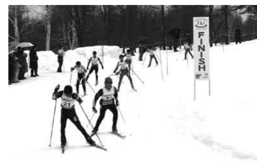
応援を受け力を出す選手