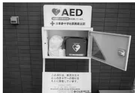
玄関入って右に設置されている

なお、日赤群馬県支部では、AED講習会をはじめ救急法等各種講習会を指導員派遣で行ってまいりますので、希望がある団体の方はご利用下さい。