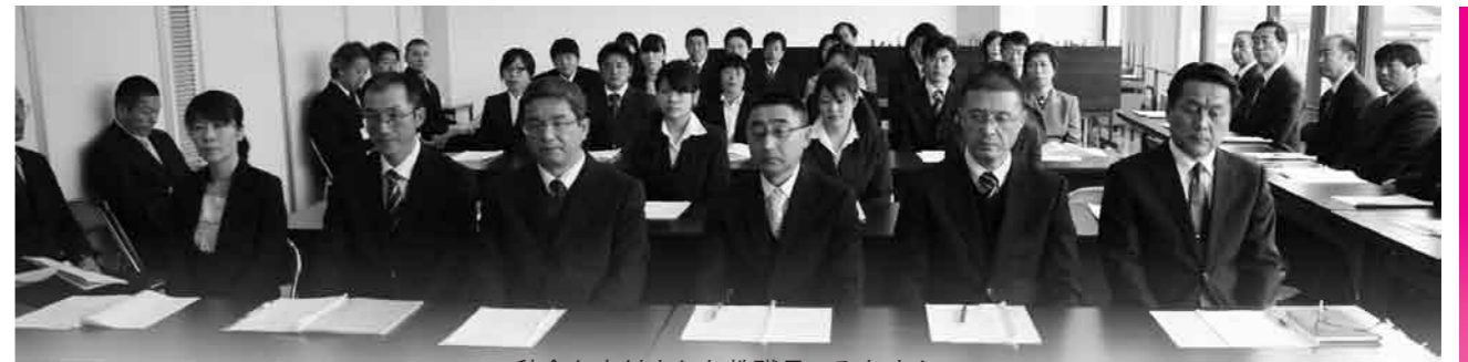
辞令を交付された教職員のみなさん