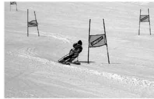
斜面変化を設け難いコースだった