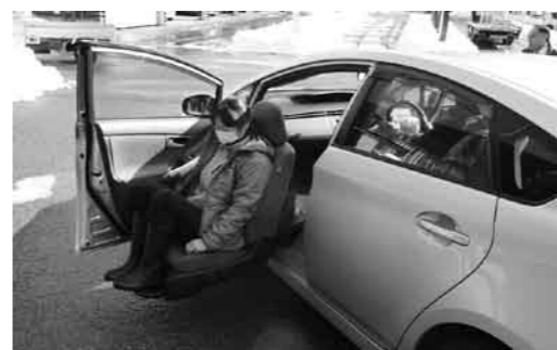
助手席リフトアップタイプ。トランクに車いすを寝かせて収納するスペースあり。

片品村では、移動する際に介護が必要な高齢者や身体障害者等を抱える家族等が、その高齢者等と一緒に外出する場合に、本人や介助者の負担軽減を図ることを目的として平成11年から助手席シートがリフトアップするタイプの福祉車両の貸出を行ってきました。