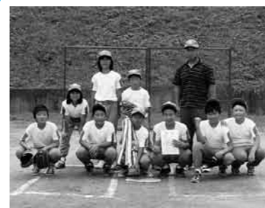
優勝した花咲Aチーム

子どもの要求や期待に、できるだけこたえてあげて。友達と学び合う小学校期。自分探しの思春期。子育ての不安や悩みをお持ちのあなたへ届けます。