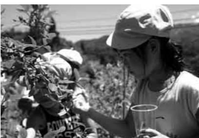
摘み取りに園児も夢中