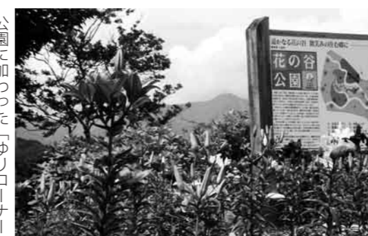
公園に加わった「ゆりコーナー」

本年度、ホワイトワールド尾瀬岩鞍さんから公共施設で利用していただきと、ゆりの花苗を計200本頂きました。村内に咲く植物が植えられている花の谷公園にゆりの花が加わり、さらに片品らしさが増しました。公園も一層華やかに、赤や黄色、オレンジといった色鮮やかな花々をご覧くださいませ。