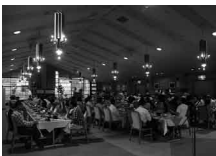
大会終了後の交流会場