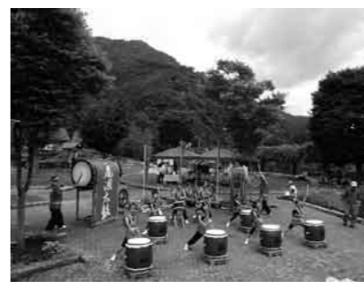
尾瀬太鼓愛好会の演奏