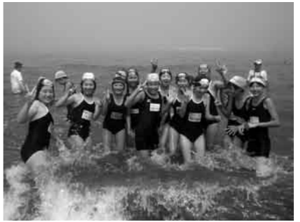
長崎海岸での水遊び