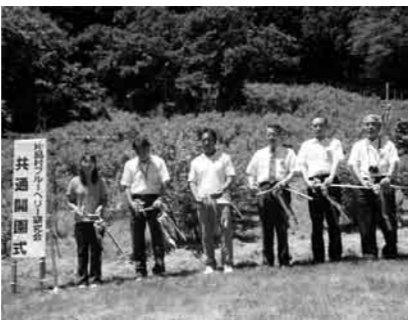
テープカットの様子

7月21日(水)、片品村ブルーベリー研究会による第7回共通開園式が御座入「桑原リンゴ園」において行われました。