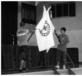
受け入れ式 JRC 旗交換

そして、校庭では、明神小学校の6年生たちが、受け入れる片品連合小学校の子どもたち一人ひとりの名前の入った幟(のぼり)を大きく振って、受け入れ相手と初めての対面をしてい