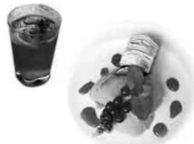
すぐりのジェラード