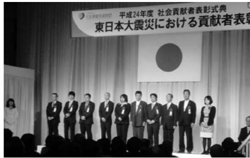
表彰式会場の様子