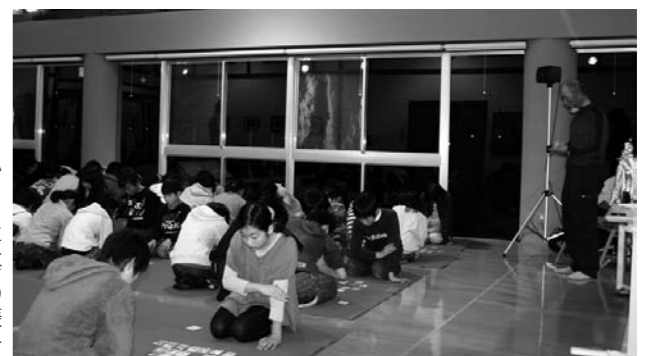
かるた大会の様子