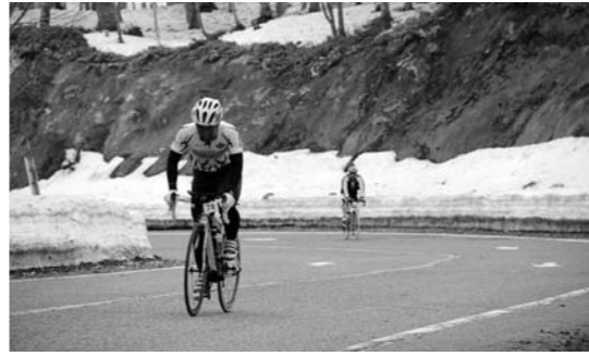
過酷な上り坂が続く

参加された方の中には、周りにも聞こえるほど『ゼーゼー』という息づかいや『ウォー』と上り坂のきつさ