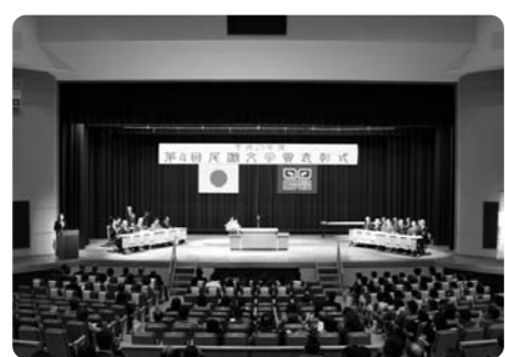
第4回表彰式会場の様子