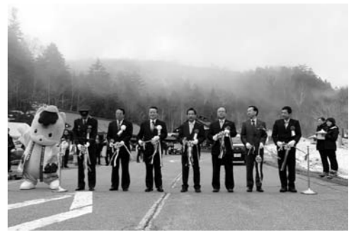
代表者によるテープカットの様子

4月27日(金)国道120号菅沼登山口において、金精道路の開通式が大勢の来賓を迎えて行われました。