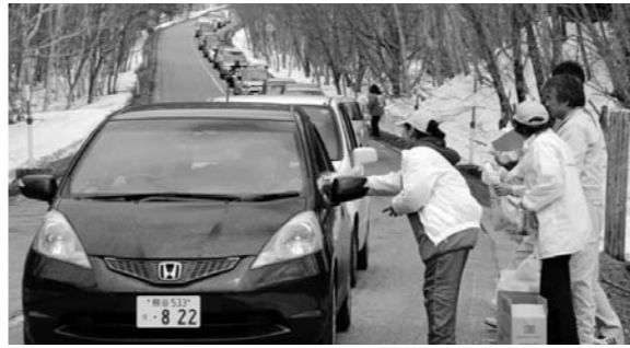
栃木県側からの車両にパンフレット配布