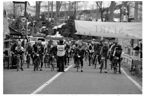
決勝レース直前！ 緊張の一瞬！！