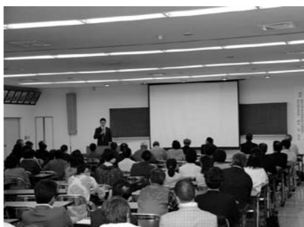
大勢集まった講演会場の様子