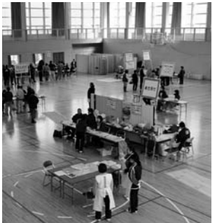
総合健診会場の様子