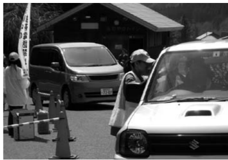
交通安全啓発活動の様子