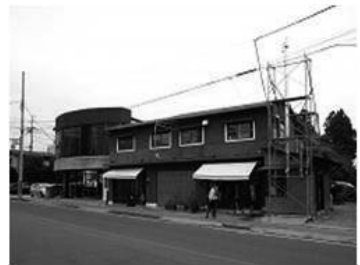
空き店舗の先進的な活用例

24年度は、先導的取り組みとして鎌田地区にある旧須藤商店を借り上げ、修繕して「村内の人々の交流と憩いの場」や「喫茶コーナー」、「村内資源の情報発信」、「特産品や尾瀬ブランドのPR」など