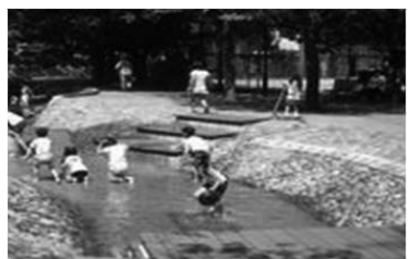
じゃぶじゃぶ足湯池のイメージ（例）

花車とハンギングバスケットなどを活用し、メインストリートの花を飾り、来訪客をおもてなし。ちょっと立ち寄ってみたいような雰囲気づくり。