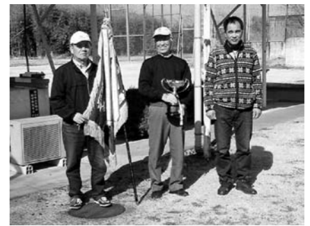
スキート団体の部優勝