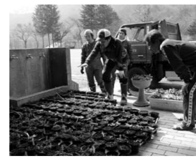
取扱いについて説明を受ける職員

四季の森ホワイトワイルド尾瀬岩鞍さんから、村内小中学校にゆりの苗を学校内美化活動の推進に役立ててくださいとたくさん寄贈いただきました。 ご趣旨に沿うよう有効に活用させていただきます。 (教育委員会)