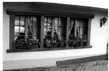
花の谷シンボルロードのイメージ（例）

（栃木県那須の SHOZO Cafe）古い建物を、おしゃれで居心地のいい喫茶店や雑貨店として改築し、首都圏からのお客様にぎわっています。