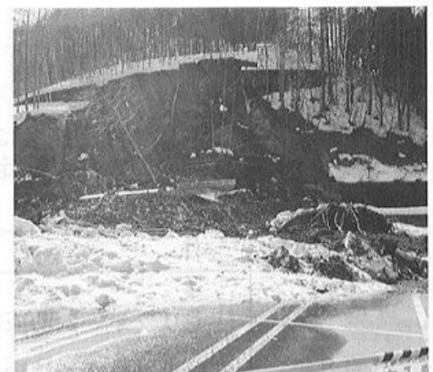
村道越本・花咲線の災害現場