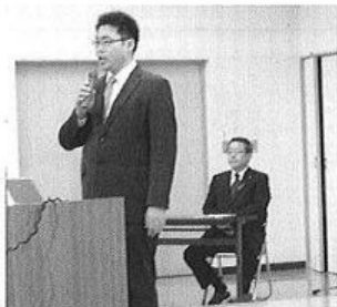
「原発事故放射線量」講演会