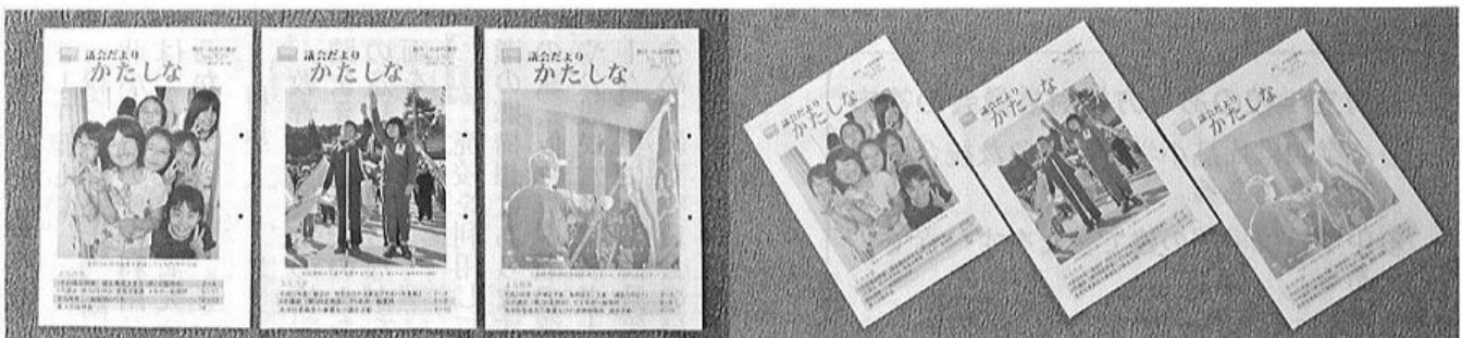
議員だよりのバックナンバー