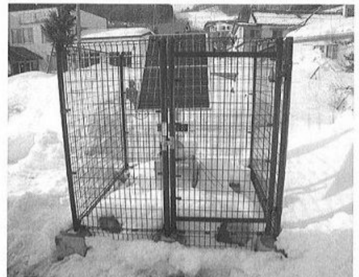
戸倉の放射線量モニタリングポスト

今後も継続した測定をして保護者に安心していただけるよう状況をみながら対処していきます。