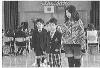
片品小学校の入学式