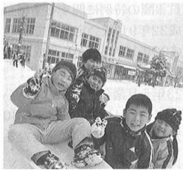
統合が答申された片品の小学校

問 村民の意見を聞き合意を得るために、アンケート調査、地区別懇談会、説明会等をする必要があると思うが。