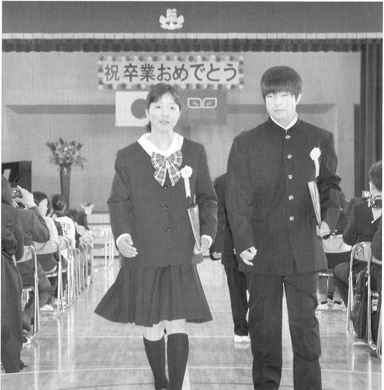
片品小学校を巣立つ卒業生（3月13日、片小体育館）