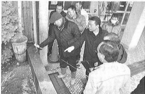
議員たちが片中玄関先で放射線量を検査