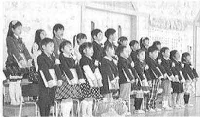
片品保育所の卒園式