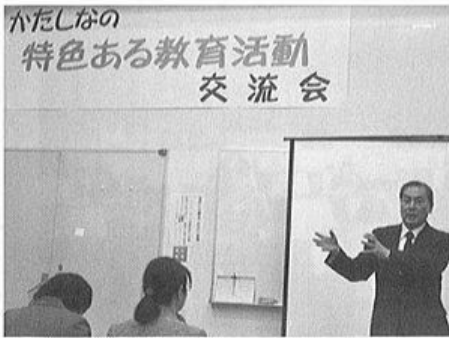
かたしなの教育活動発表会