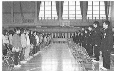
片品小学校の卒業式