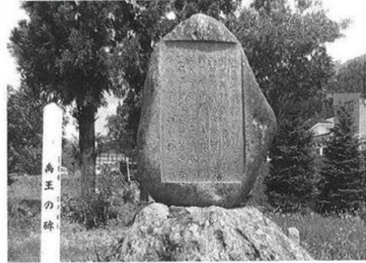
禹王サミットを迎える禹王の碑

特別会計は、前年度比101.2%ですが、一般会計から全体の25%を繰り入れています。