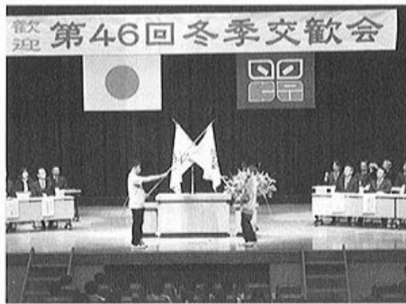
銚子小学校との冬季交歓会受入式