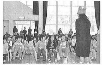
片品保育所の入園式