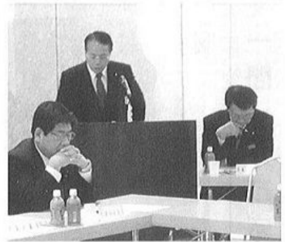
群馬県町村議会での片品事例発表