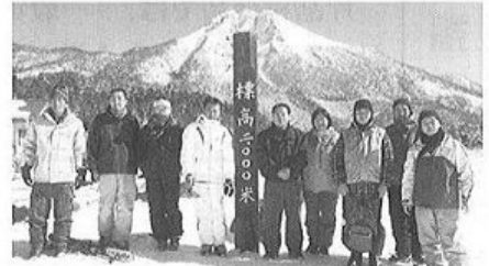
丸沼スキー場での視察・研修