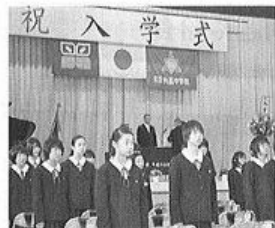
片品中学校の入学式