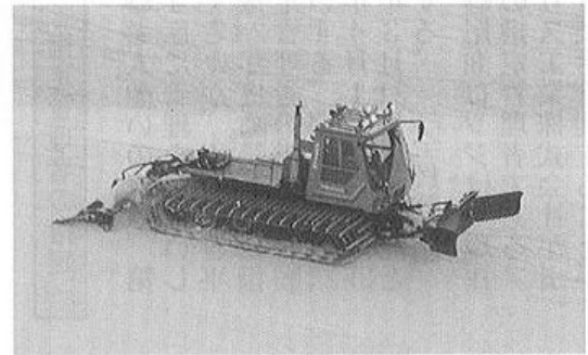
廃車処分される圧雪車

※ 一般会計に災害救助費として1億7,567万円の県負担金があった。学校建設基金1億円、財政調整基金に1,400万円それぞれ積み立てた。