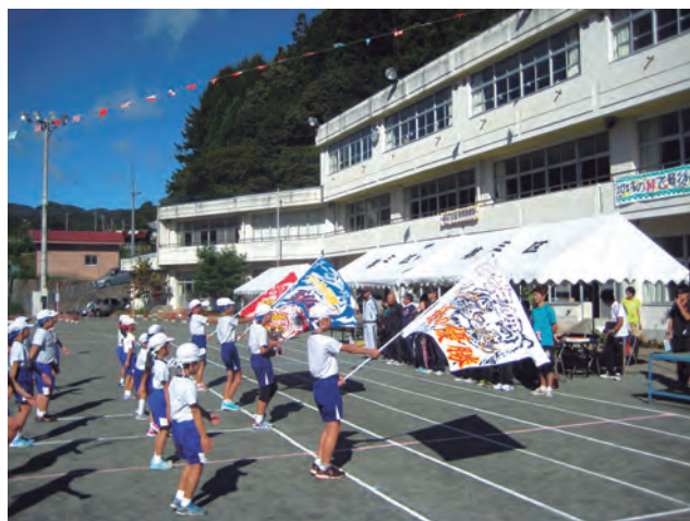
片品南小学校運動会