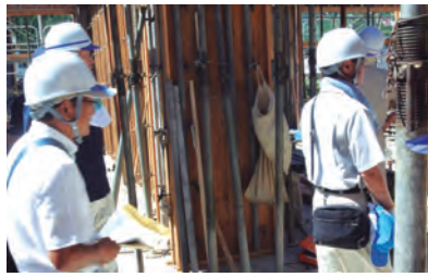
視察先の片品小学校建築現場