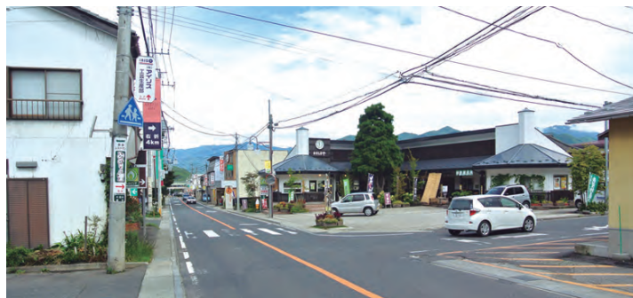
尾瀬の郷駅整備が予定されている鎌田商店街

道の駅整備に向けての基本設計費として計上。(仮称)尾瀬の郷駅整備イメージは、鎌田