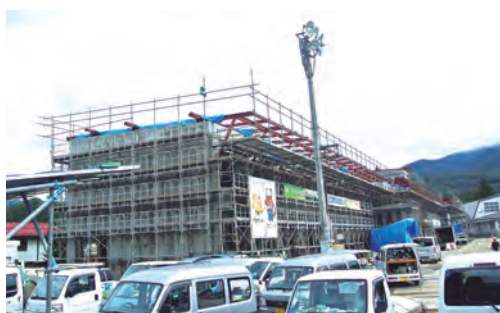
建築中の片品小学校