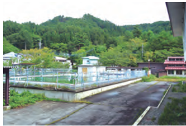
プール等の跡地に臨時校舎が建築される

村が管理する橋は70橋あるがその内、橋長15m以上の22橋が国で定める長寿命化修繕計画事業にあたるが、補修工事が進む三松橋、今年度から補強工事に