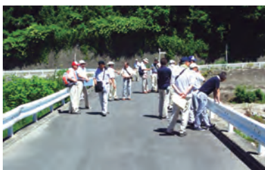
今年度から補強工事に着手する学校橋

着手する学校橋や平成29年度から調査設計に入る細工屋橋等の現状を視察した。 点検結果により優先順位をつけ順次補修を行って、安全かつ円滑な道路交通の確保を行う。