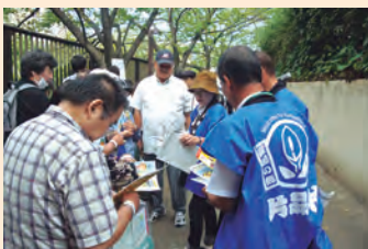
アンケート調査の様子

この祭りに参加した片品村議会は、むらづくり観光課職員と地域おこし協力隊の協力を得て、会場に片品村のブースを設け、トマトやトマトジュースの販売、祭りの参加者へのアンケート調査を実施し、片品村のPRと目黒区民との交流に努めてきました。