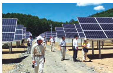
築地地区で稼働している尾瀬の郷ソーラーファーム

東日本大震災発生後に全国各地で再生可能エネルギーの取組みが進んでいるが、築地地区で今年1月から運転開始している太陽光発電所を視察した。発電所は、パネル設置面積38,600㎡で、2,100kwの出力を生み出し、環境に関する負荷軽減にも配慮した施設である。今後、耕作放棄地を利用した太陽光発電