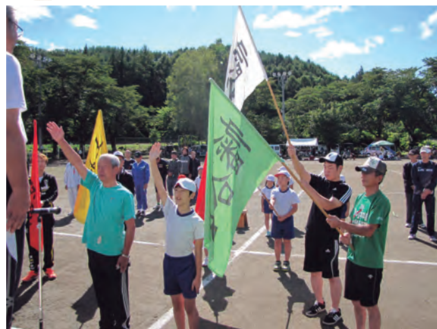
武尊根小学校運動会

12月議会を傍聴しませんか！ 次回定例会は、12月4日（金）の予定です。 一般質問は、開会初日です。なお、一般質問の質疑応答（全文）は片品村公式ホームページ（HP）にて閲覧できます。HP掲載写真はフルカラーです。 URL http://www.vill.katashina.gunma.jp/