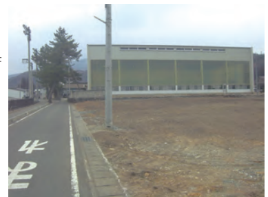
児童館の建設予定地