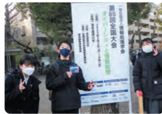
第5回中高生情報学研究コンテストの会場にて

本校では自然環境科や理科部の活動を中心に、利根片品地域の自然環境についてあらゆる調査活動を行っておりますが、これらの研究成果は、長年にわたり、積極的に学会に参加し、発表をしています。学会と聞くと、研究者が集まり、専門的な発表が行われるイメージがありますが、若い世代への啓発などを目的に、中高生向けに分科会を用意し、ポスター発表が行われる学会も多くあります。