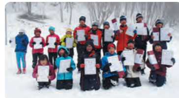
2/26 選手一同(クロカン)