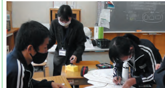
第2回ワークショップ

○令和4年11月21日(月)に行われた第2回ワークショップでは、生徒の思い出が詰まったものから「タイムカプセル・ジュエリー」を作成しました。