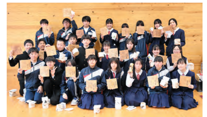
片品っ子プロジェクト卒業式