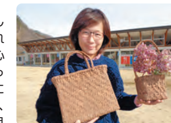
山ぶどうのカゴが完成しました！

昨年12月から始めた山ぶどうツルのカゴ編みはようやく完成となりました。1つは定番のバッグ型、もう1つはバッグ作りで出た切れ端で作った花入れです。編み方が早い人は1ヶ月で2～3個のバッグを作れるそうですが、初心者の私は3ヶ月もかかってしまいました。編み終わると、タワシでゴシゴシこすって毛羽立たせ、毛羽立ちをガスバーナーであぶるという作業を繰り返して、最後に内側に布を貼って仕上げます。後は使うことで独特のツヤが増えていくそうで、100年保つといわれる山ぶどうのカゴの成長を楽しみたいです。また広報2月号に山ぶどうのカゴ編みをしていることを書いたところ、片品でもミヤマカンスゲ(通称:岩芝)でカゴ編みをしていた人が越本にいたことなどを教えてくださる方がおり、大変参考になりました。現在もカゴ編みができる方をご存じの方がおられましたら、是非お知らせください。