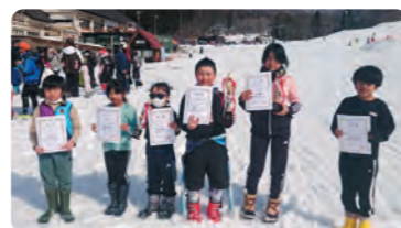
3/12 片品入賞者(アルペン)