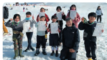
3/11 片品入賞者(アルペン)