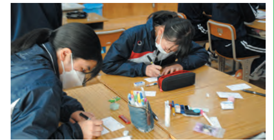
第1回ワークショップ

○令和4年10月11日(火)に行われた第1回ワークショップでは、生徒が片品村のお気に入りの場所・思い出の場所の動画を撮影したり、その場所の石を持ち寄ったりして、「片品村思い出マップ」を作成しました。