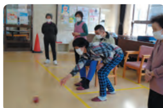
ひだまりカフェ・ボッチャ