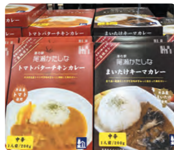
売店に並ぶレトルトカレー