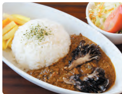
食堂で提供しているキーマカレー