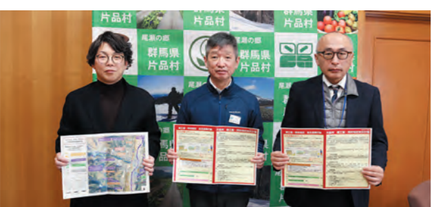
群馬大学 金井教授 片品村長 国交省利根川水系 砂防事務所長