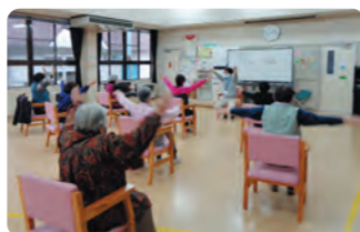
はつらつ体操教室