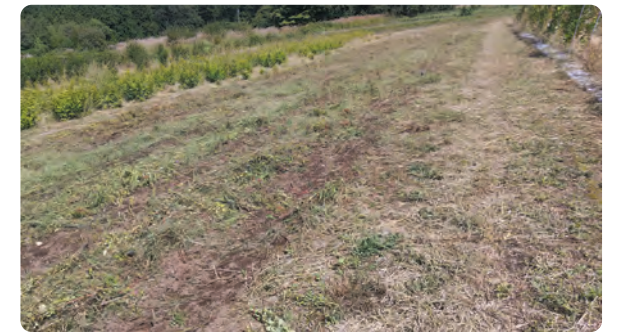
来年に向けた準備