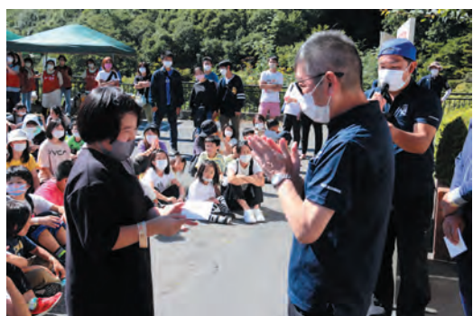
多くの皆様のご参加に感謝!

当日は好天に恵まれ、57チーム、192名の方々にご参加いただきました。初めてのイベントであるため、競技の時間配分や運営面で円滑に進められず、参加者の皆様にご迷惑をおかけした部分も多々ございましたが、無事表彰式まで終了することができました。参加者の方々からは「とても楽しかったのでまた是非