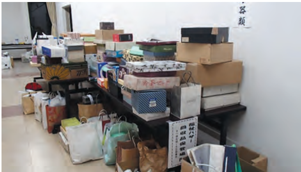
前回集まったバザーの商品