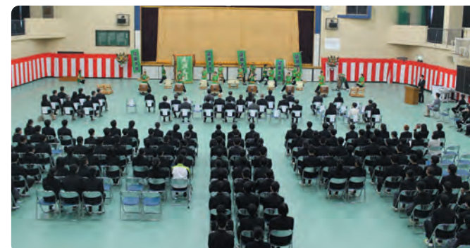
記念事業として会場で披露された尾瀬太鼓の演奏

式典後には記念事業として尾瀬太鼓愛好会をお招きし、5つの曲を力強く演奏していただきました。他にも生徒原画の特製クリアファイルを作成したり、校歌斉唱の音源を作成したりしました。校歌斉唱の動画は尾瀬高校公式YouTubeでも公開しておりますので、ぜひご覧ください。