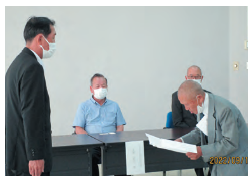
メッセージの伝達

群馬県では9月を【知的障害者福祉月間】とし県民の皆様幅広く周知し知的障害者に対する理解を深めていただく