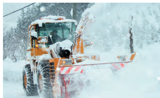
道幅ぎりぎりまで除雪作業する除雪隊員

道路の事故防止、安全確保のために樹木の所有者のみなさんは伐採や枝払い等を行うことにより適切な管理をお願いします。