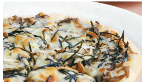
お得なピザと生ビールがおすすめ！