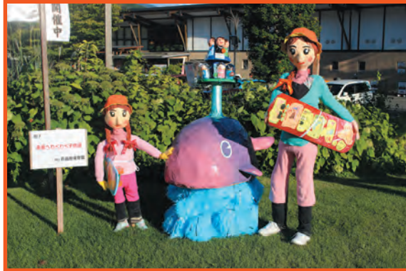
グランプリ作品「未来へわくわくこども達」