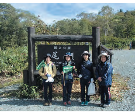
婦人会8支部の皆様

片品村婦人会では主に地域に貢献できるような活動を行っています。今回ご協力いただいた片品村婦人会8支部の皆様、大変ありがとうございました。(教育委員会)