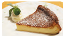
おすすめのチーズケーキ

夏の温活フェアとして平日に限り岩盤浴の利用を半額とさせていただきます。岩盤浴で整った後には新メニューのチーズケーキもおすすめです！