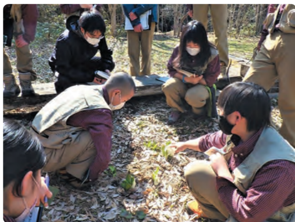
研修2日目、校内の自然植物園を会場に実際に自然観察会を実演

この研修は20年近くわたって毎年4月に実施していますが、「相手に伝える」ということはどういうことなのか、人として大事なことを学習することにも繋がっています。