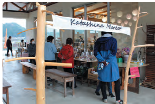
天候が良くなくても回廊にて出店できます

今後も、7月10日(日)、8月7日(日)と、11月までの毎月開催されます。地元の方々はもちろん、片品村を訪れるお客様も楽しめる空間づくりを目指していますので、村民の皆様のご来場をよろしくお祈りいたします。