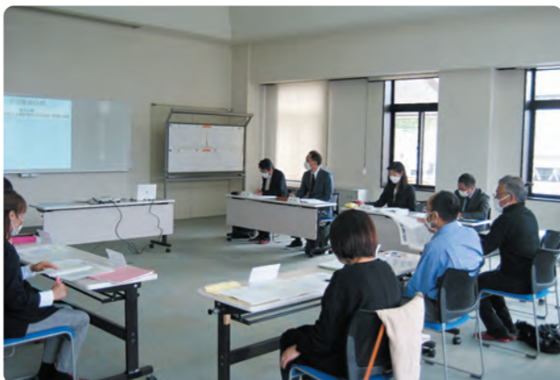
片品村学校運営協議会開催の様子

この会議も今年度で2年目となりますので、「できることから少しずつ、形にしていきたい」と会長さんからお話がありました。昨年は新型コロナの影響もあり、十分な活動ができませんでしたので、まずは1歩ずつ、そんな気持ちで皆さんの思いを集めていけたらと思います。(教育委員会)