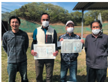
スキート団体の部 優勝