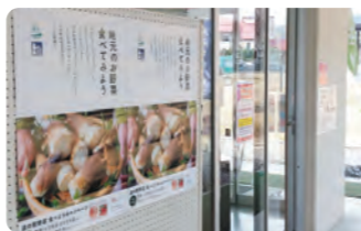
ポスターの掲示場所の例

また道の駅内に村内で行われるイベント等のポスターを掲示するスペースを設けております。掲示の手続きについては道の駅事務所にお問い合わせください。