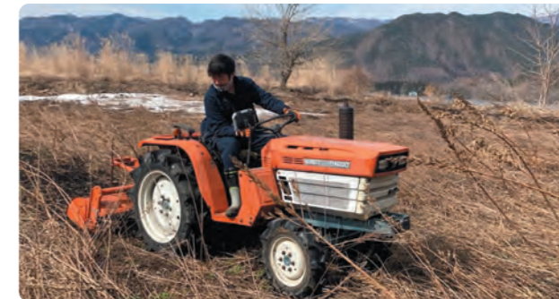
トラクターでの作業の様子