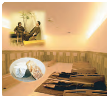
岩盤浴の利用の様子

【フェア期間】6月1日(水)～7月14日(木)まで 【岩盤浴村民利用料金】700円→350円 ※別途入浴料が必要です。