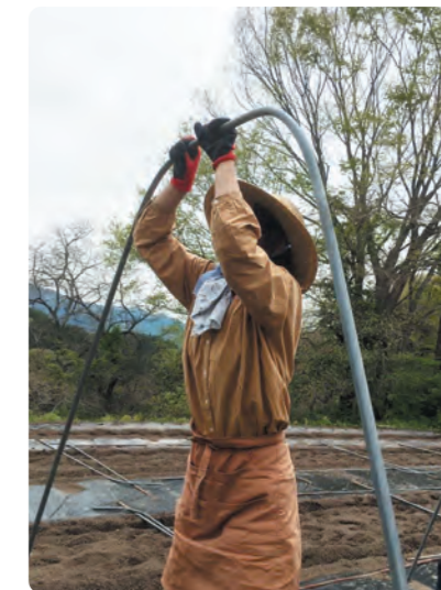
花豆支柱立て作業