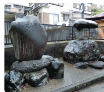
文命西宮・西堤碑

第4部は「地元歴史等研究団体の活動と出版物紹介」で小田原史談会、足柄の歴史再発見クラブ、足柄平野地名研究会、高尾山とんとんむかし語り部の会から説明がありました。2日目は巡検(現地見学)を