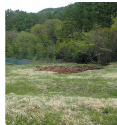
武尊牧場スキー場跡地での花豆試験生産

地域包括センターの業務では移動販売車に同行し、村内各地域をお伺いさせていただきました。遠くまで買物に行けない方の買物の場としてはもちろんのこと、「今日は〇〇さんが来てないね」とお互いに心配し合う大切な見守りの場になっていると感じました。コロナ以来中止となっている地域サロンを再開してほしいなどの声を寄せてくれる方もおられました。これからも気軽に声をかけていただければありがたいです。