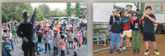
村長とのじゃんけん大会の様子