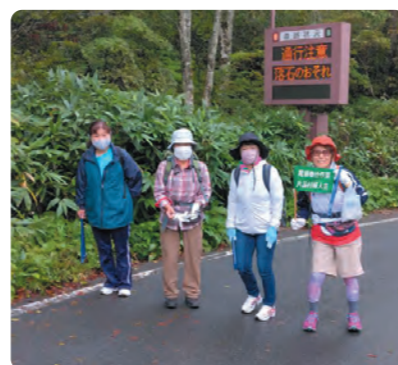
片品村女性会メンバー