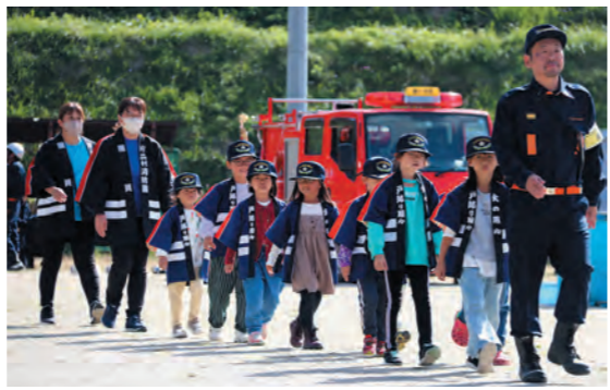
ちびっこ消防団による行進

当日は雨が降り、あいにく の天候ではありましたが、文 化センター内で区ごとの記念