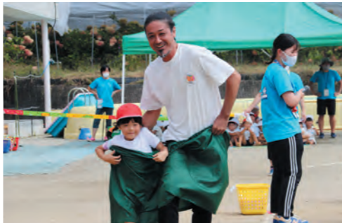
がんばれ!デカパン競争!