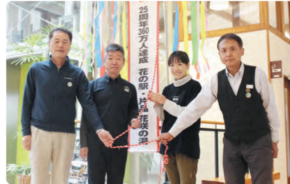
25周年記念のくす玉割り