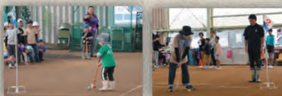
グランドゴルフの様子