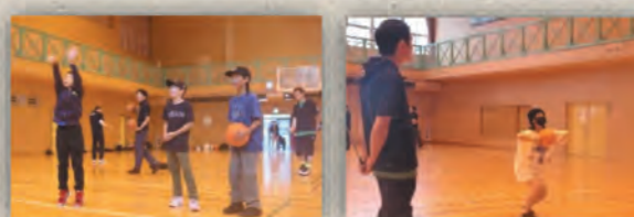
フリースローの様子