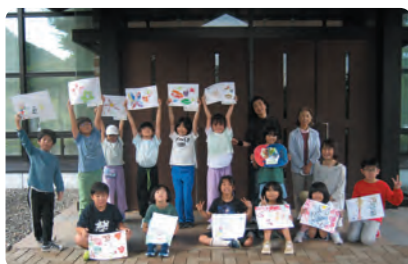
みんな上手にできました！