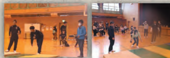
スマイルボウリングの様子