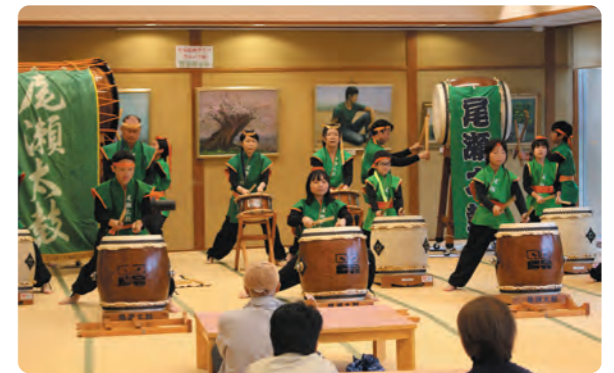
大広間で尾瀬太鼓演奏