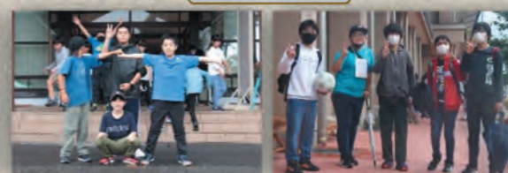
みんなで楽しめました！！