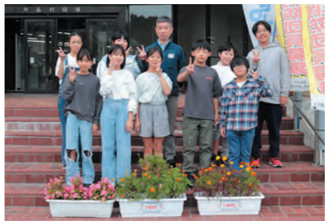
片品村役場へ寄贈

10月3日(火)に人権や福 祉活動の一環で片品小学校環 境美化委員会の生徒の皆さん が育てた花を、寄贈いただき ました。庁舎の玄関に飾って あり、多くの人の目を楽しま せています。