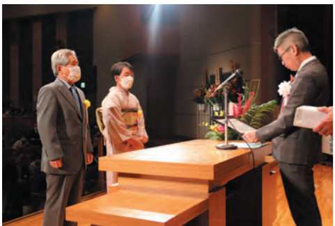
高齢者夫婦の表彰