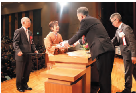
金婚式夫婦の表彰