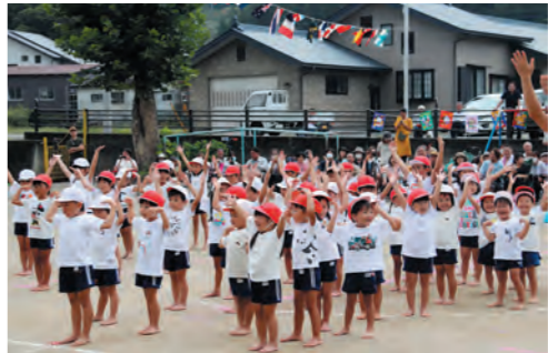
みんなでラジオ体操!