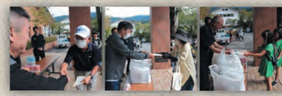
総合優勝 チームリリー