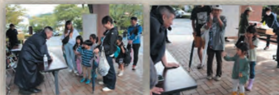
大魔王じゃんけんの様子