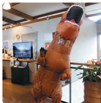
ティラノサウルス！