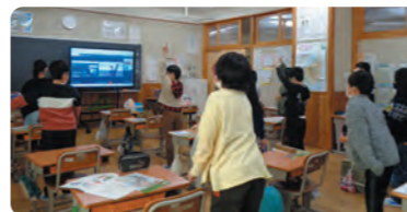
片品小でのオンラインによる認知症サポーター養成講座