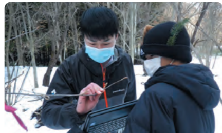
校内にある自然植物園を会場にオンライン形式による自然観察会も実施

来年度は普通教科においても本格的な遠隔授業が始まる予定です。今後も地域や生徒のニーズに合致した学習活動を推進していきたいと思っております。