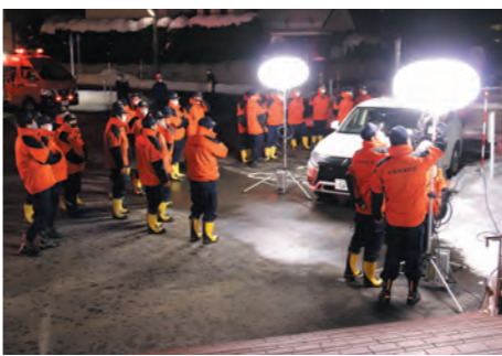
夜間照明設置訓練