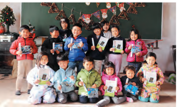
さんさん森のようちえん