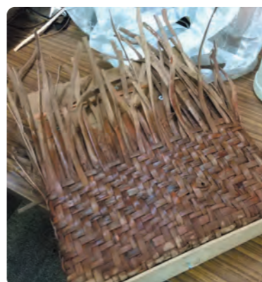
山ぶどうのカゴ作り

地域包括支援センターでは12月16日(金)に、片品小4年生を対象に認知症サポーター養成講座を開催しました。コロナ渦で廊下を挟んだ教室からオンラインでの講座でしたが、1時間半の講座を熱心に聞いて、グループワークでは自らの意見をはっきり答える生徒さんたちに感心しました。こういった講座を通して認知症や高齢者への理解を深める機会を、地域包括支援センターが作ることの重要性を感じることが出来る時間となり、今後も積極的に出前講座等を行いたいと思っております。