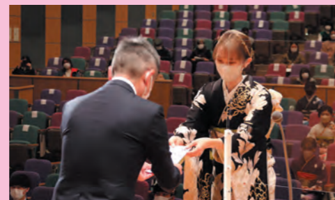
二十歳(はたち)を祝う会記念品贈呈の様子