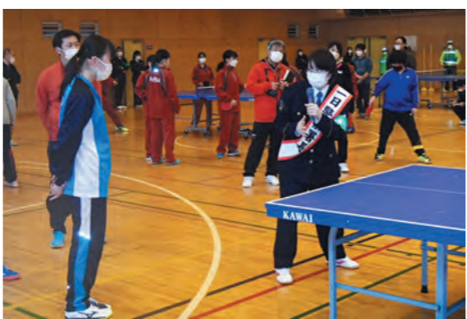
参加者の中学生に熱心に指導していただきました!感謝!