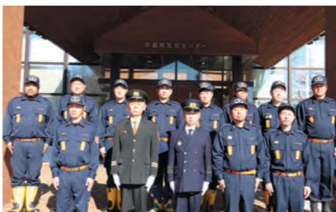
片品村消防団幹部会