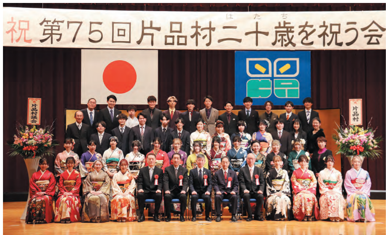
※撮影時のみマスクを外しています

1月8日(日)第75回片品村二十歳(はたち)を祝う会が、対象者(該当者45名のうち40名が参加)とご家族、ご来賓の方々の出席により行われました。