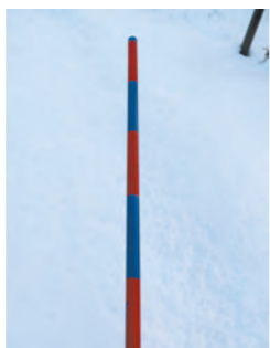
消防施設用ボール