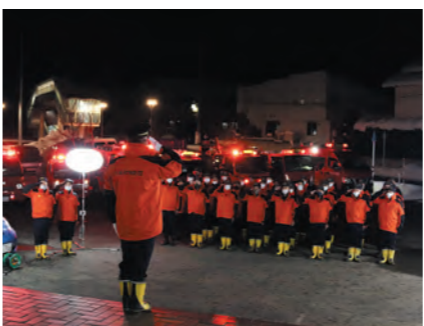
歳末特別夜警激励式