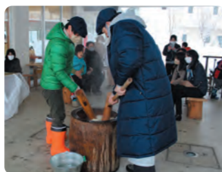
餅つき大会 道の駅

雪にも恵まれ、もちつき大会当日はスキー場からの帰りのお客様がたくさん参加し、片品産のきな粉、大根、あんこをまぶして片品村の味を楽しんでいました。また、道の駅では同時に甘酒も振る舞われ、にぎやかで温まる時間をお過ごしいただきました。