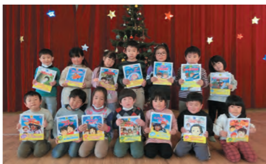
片品保育所の園児