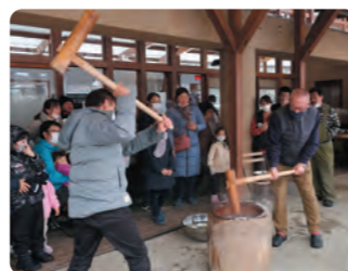
餅つき大会 道の駅