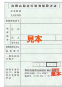
令和6年8月1日～ 令和7年7月31日の 被保険者証「緑色」