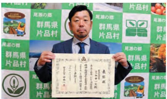
群馬県消防防災功労知事表彰 受賞