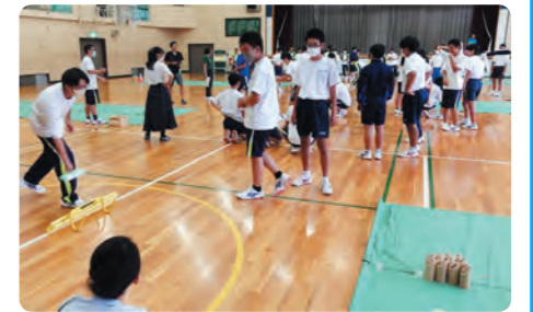
昨年9月に続き、今年も開催予定の「中高モルック大会」

このように実際にモルックを通じて、高校生と中学生とが交流を深めることにもつながっています。機会があれば、ぜひ皆さんにも、楽しんでいただきたいです。