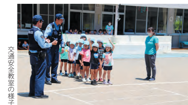
交通安全教室の様子