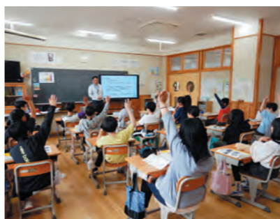
租税教室でクイズに答える6年生