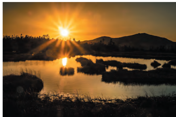
第19回片品村長賞受賞作品「染まる池塘」