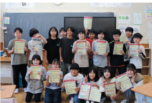
みんなで集合写真 (総務課)