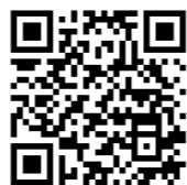
片品村 「空き家&仕事バンク」 HP

片品村では、移住定住の促進のため「空き家&仕事バンク」としてWEBサイトを開設しております。現在、問い合わせを多くいただいている状況ですが、登録されている物件が少ないため、条件に合わない・照会できないといった事例が何件あります。そのため、活用できそうな空き家を持っている方は、移住者の住む場所の選択を増やすため、是非空き家バンクに登録してください。また、サイト名のとおり、仕事の紹介も行っています。スキー場のアルバイトや、事務の正社員、農業の期間業務等種類は問いません。従業員が足りない・ちょっと忙しいから短い間でも人手が欲しいなどありましたらぜひ、掲載を検討してください。