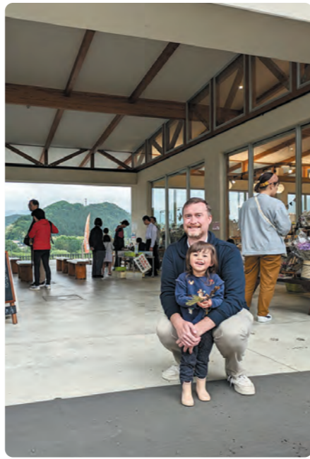
かたしなマーケット(6月)

As tsuyu, the rainy season, has started, there has been a lot of rain. Even so, there have been some events, such as the Katashina Market at the roadside station Oze Katashina in June. Usually, it is outside on the grass but this time it was held under the roof, it's great that it can still be held even when the weather is bad. I met some students from Oze High School there. They were members of the nature studies club and had a stall to make your own decoration from natural items such as wood, leaves, acorns and so on. They collect the items from the local area around the school. To make the decoration you choose a piece of wood and some of the other items from baskets and then use a glue gun. The students were all very helpful in choosing the items and for how to make it, so even my two-year-old daughter could try making one easily. There were also many other children who could make them. This nature craft is a wonderful activity for them to be creative and learn about things from nature. There were also other stalls selling their goods and food stalls. It's a good way for local businesses to show their wares and we could enjoy delicious food. It's a fantastic event that I hope to go to again.