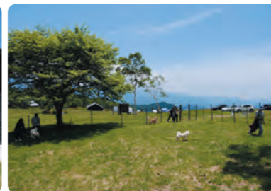
HOSHISORA BOOK CAFE テラスとドッグラン