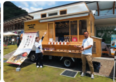
海と山のマルシェの様子