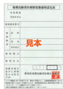
限度額適用認定証

※限度額適用認定証及び限度額適用・標準負担額減額認定証の色は被保険者証と同じ「緑色」です。