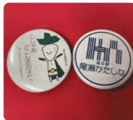
片品愛あふれる缶バッジ