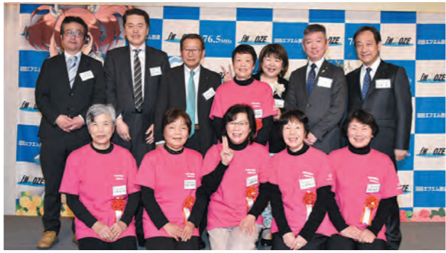
食生活改善推進員の皆様

1月26日（金）にホテルベラヴィータにおいて「第22回沼田エフエム放送ハートウォーミング大賞」の表彰式が開催され、片品村食生活改善推進員連絡協議会が、【大賞】を受賞いたしました。