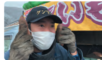
ご来店お待ちしております！！

仕入れ先のさつまいもが続く限り販売する予定ですので、どうぞよろしくお願いいたします。