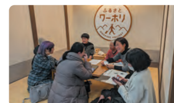
来場者との座談会