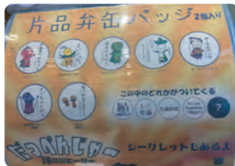
種類が増えています