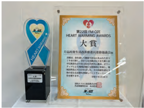
表彰状とトロフィー