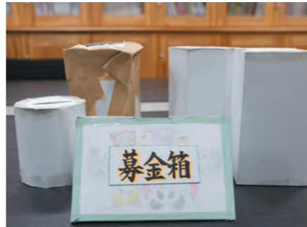
片中生が作った募金箱