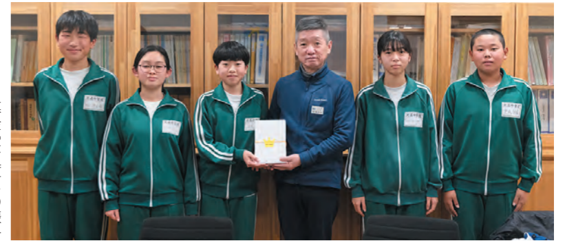
募金受け渡しの様子

第8区の活動に積極的に活用され、地域の連帯感や自治意識の向上に役立てていただきたいと思っております。