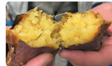
甘くておいしいサツマイモ