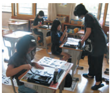
片品小学校で行われた書道教室の様子

春に菊のさし芽をされた苗をいただき、小鉢に植え一年の始まりです。必要経費を少しでも抑えるため、ナラや栗などの落