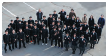
令和5年度卒業生一同