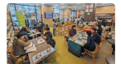
利根沼田5市町村による個別相談会