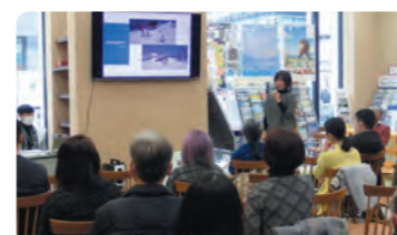
セミナーでのトーク

また移住を考えている方の第1の心配は「仕事」と思っていたのですが、まず「住居」が1番と考えている方が多かったようでした。現在、片品村では提供できる空き家情報が極めて少なく、村内の空き家や賃貸住宅を募集しているところですが、さらに空き家バンクの拡充を図る必要があることを認識できました。開催する側にとっても、非常に有意義な移住セミナーになったと思います。