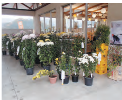
菊花 文化展の様子

ち葉を集め、腐葉土を作り、土は山から掘ってきて天日干しにして、腐葉土と土を合わせておき、定植用土として使用しています。ただ昨年の夏は気温が高く、花の咲く時期が十日以上も遅れ、良い作品ができませんでした。今年こそ良い花を皆で作ります。