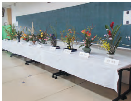
華道 文化展の様子