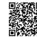
国税庁LINE公式アカウント