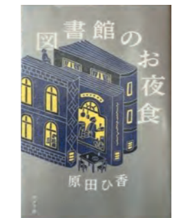
原田 ひ香 ポプラ社

※午後2時00分～5時30分開室 ※休館日 土曜、日曜、祝日 ※予定は変更される場合がありますので、あらかじめご了承ください。